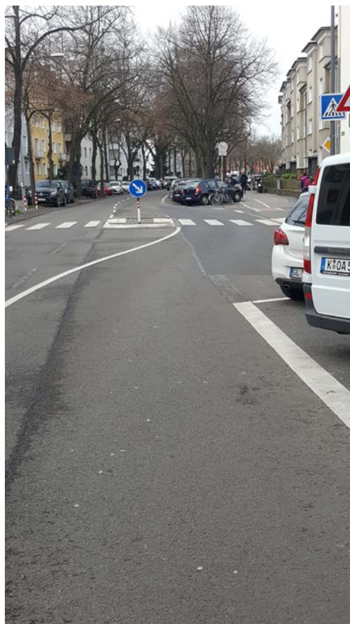
(Sichtachse aus der Pkw-Perspektive auf den Fußweg am Zebrastreifen)