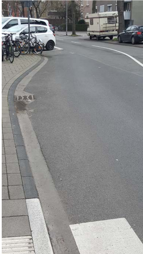
(Sichtachse vom Fußweg am Zebrastreifen auf die Straße)